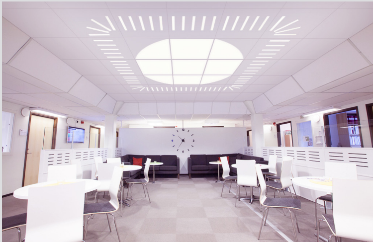
TileLight kombinationsexempel: Square | Turn | Pin | Bow