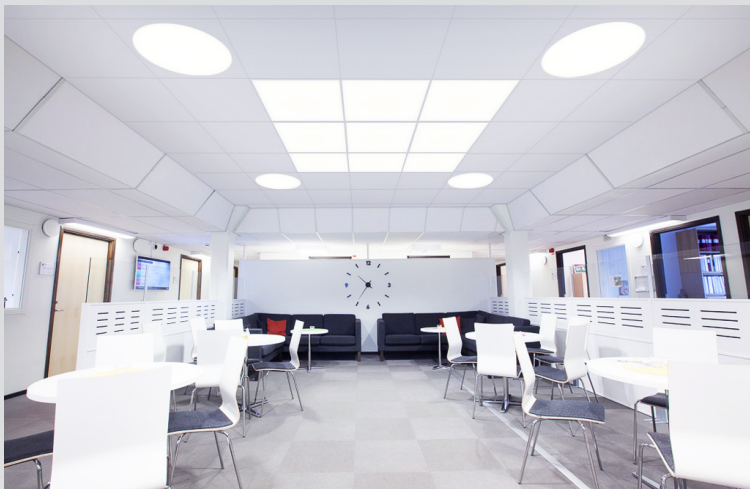
TileLight kombinationsexempel: 9x Square | 4x Circle