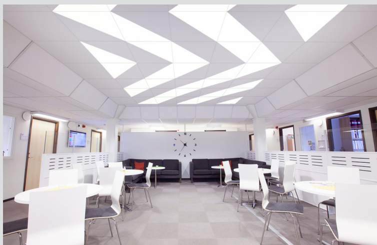
TileLight kombinationsexempel: Endast Cross