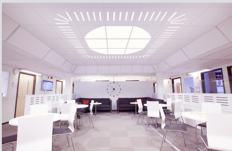
TileLight kombinationsexempel: Square | Turn | Pin | Bow