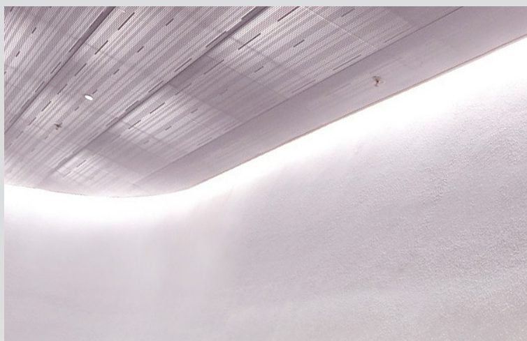
TileLight kombinationsexempel: Rak wwt möter radiell wwt